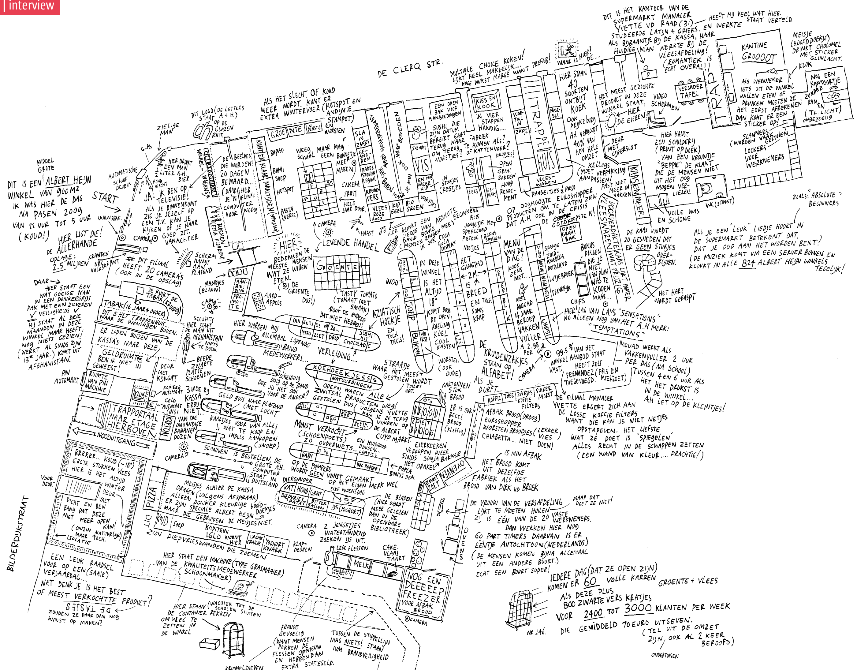
3 Supermarkt: Albert Heijn winkel (Amsterdam-West, 2009) In deze buurtsupermarkt lopen in een goede week drieduizend mensen naar binnen. Ze kopen een pak melk of kiezen uit de veertig verschillende soorten ontbijtkoek hun favoriet. Vlees vers verpakt in piepschuimen bakjes en de voorgebakken pizza's worden zodra ze bij de kassa onder de scanner gaan via een gigantische computer in Duitsland opnieuw besteld. Zodat het er de volgende dag gewoon weer is. Bron - Jan Rothuizen, Amsterdam